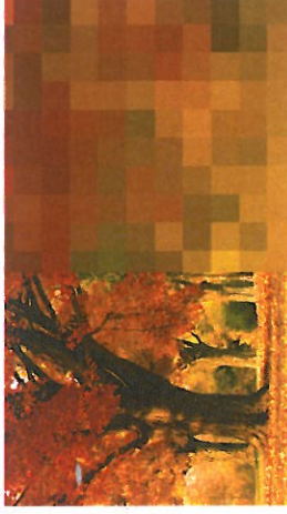
Original der Fächerknotenbestimmung am Beispiel der Bestandslogistik